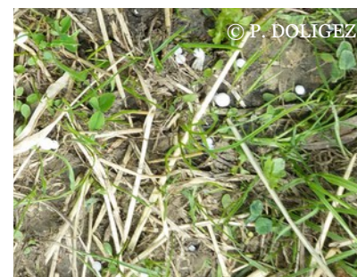
Épandage d'engrais binaire chimique sur prairie

Demander plusieurs devis pour le choix de l'engrais en fonction des apports nécessaires pour la parcelle concernée. La fertilisation phospho-potassique sera étendue pour l'ensemble de l'îlot de parcelles de même profil pédologique.