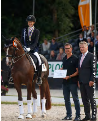
Sultan des Paluds, étalon Hanovrien

Sources : Fédération Équestre Nationale, Hannoveraner Verband, Ifce-SIRE, d'après données 2017 au 21/02/2019