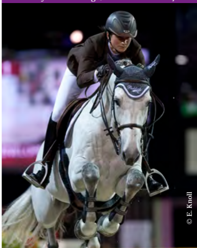
Mylord Carthago, étalon Selle Français